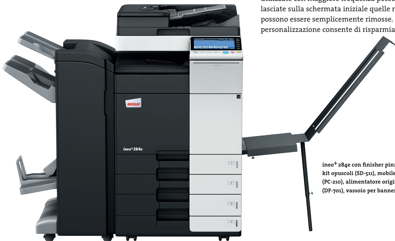
ineo+ 284e con finisher pinzatore (FS-534), kit opuscoli (SD-511), mobiletto con 2 cassette (PC-210), alimentatore originali Dual scan (DF-701), vassoio per banner (BT-C1e)

Molti sistemi multifunzione per ufficio sono complessi da utilizzare. ineo+ 224e/284e/364e, viceversa, è semplicissima. Un concetto di funzionamento semplice e intuitivo assicura una facilità d'utilizzo analoga a quella di uno smartphone o di un tablet. Il touchscreen capacitivo da 9 pollici è dotato di funzioni note come flick&drag e grazie a una nuova struttura di navigazione del menu è possibile visualizzare tutte le funzioni contemporaneamente e selezionare le impostazioni desiderate con pochi clic. Le funzioni utilizzate con maggiore frequenza possono essere lasciate sulla schermata iniziale quelle non utilizzate possono essere semplicemente rimosse. Questo tipo di personalizzazione consente di risparmiare tempo.