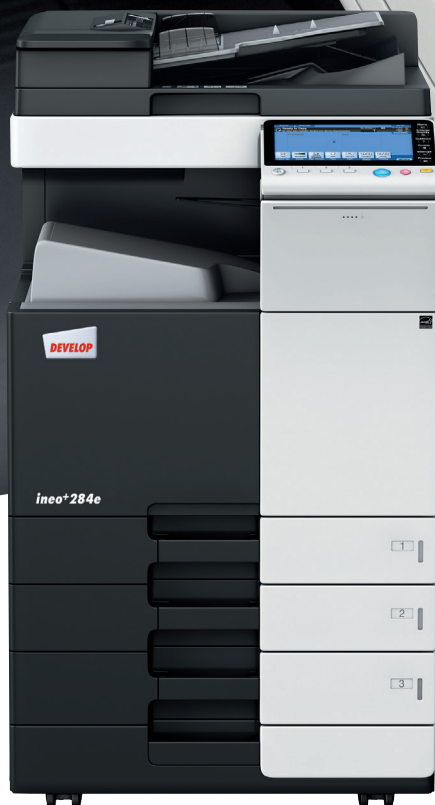
ineo+ 284e con mobiletto con cassetto da 500 fogli (PC-110) e alimentatore originali Dual scan (DF-701)